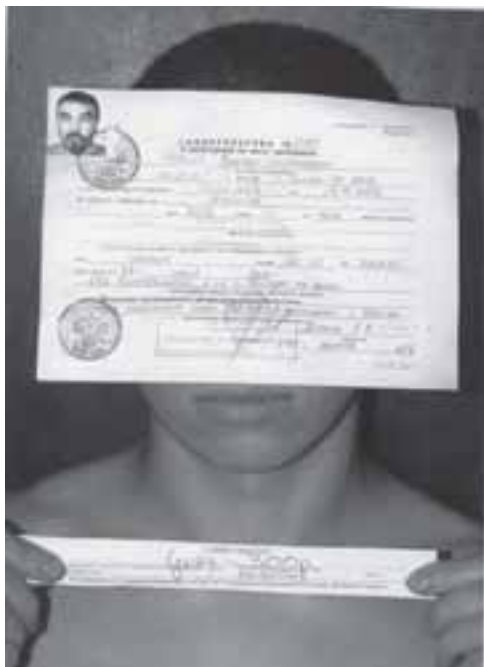
А. Денисов, В. Черенов. Иллюстрация к 27-й статье Конституции РФ. Проект «Артконституция». 2003

Мы видим, что в условиях непрерывного экспериментирования в основных своих чертах крепостное право в тех или