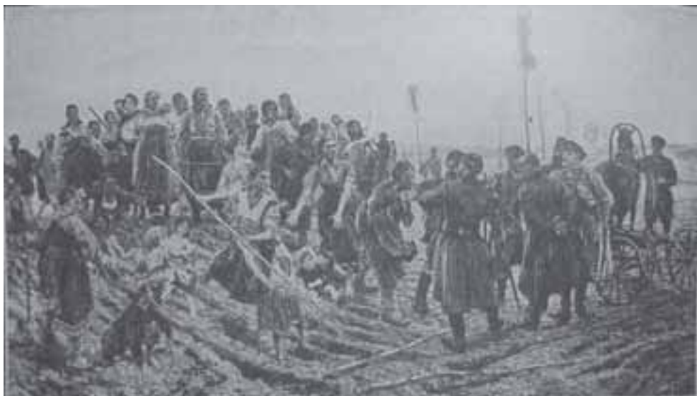
К. Савицкий. Спор на меже. 1897

ству в течение 49 лет из расчета 6% годовых. Однако вряд ли простому русскому крестьянину был понятен такой шаг: он плохо разбирался в сути банковского кредитования, зато хорошо понимал, что земли он так и не получил, из-под власти помещика не освободился.