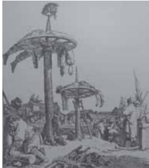
Колесование. XVIII в.

Потребность в свободе выражалась и в том, чтобы выйти за пределы той тридцативерстной черты, которая была очерчена наличием паспорта Российской империи. Никто не мог выйти за пределы этой черты, правда, и дворяне в том числе, которые тоже были по-своему закрепощены. Это не значит, что правительство непрерывно надзидало за каждым дворянином. Но когда возникала необходимость покарать ослушника, когда, скажем, матушка Екатерина была кем-то недовольна, но при этом, будучи большой законницей, не собиралась вчинять судебный иск и начинать судебный процесс, то тем не менее располагала возможностью распорядиться о том, что такого-то столового дворянина, князя такого-то, например тургеневского предка, отправить в его деревню. И он там сидит безвыездно, как сидел И. С. Тургенев. Сидит, потому что его статья не понравилась Николаю I. А ведь это сплошное нарушение закона.