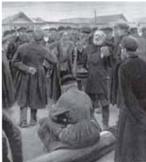
С. Коровин. На миру. 1893