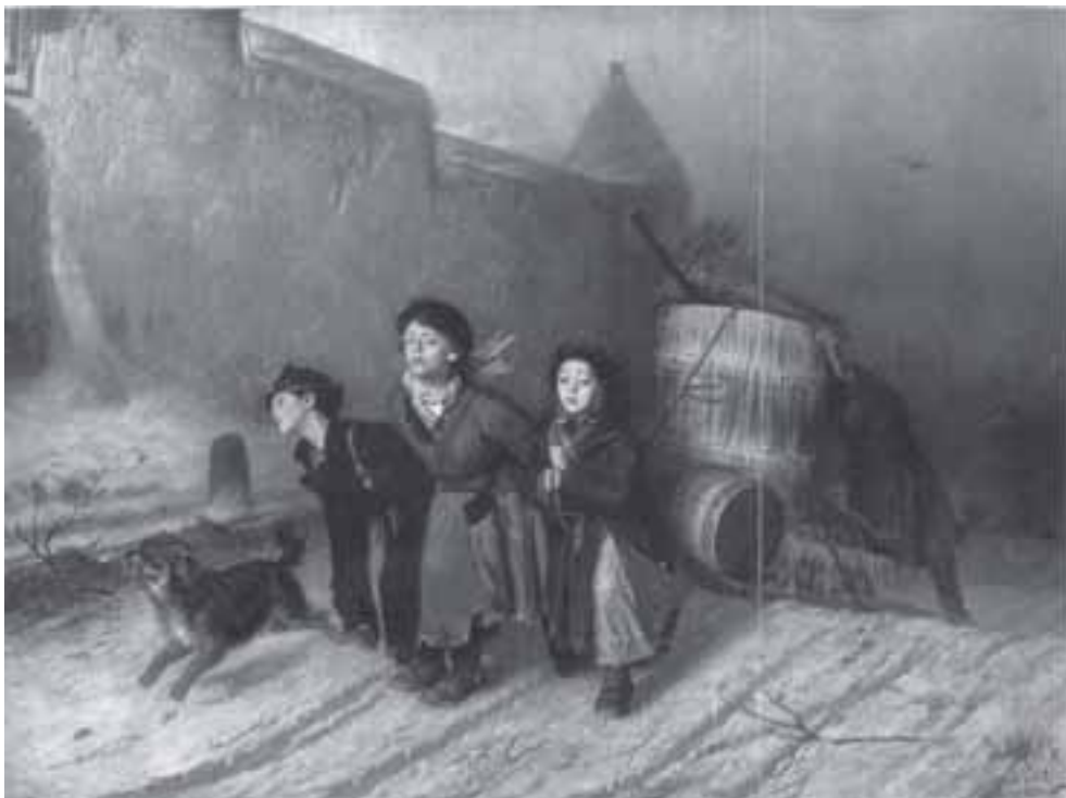
В. Перов. «Тройка». Ученики-мастеровые везут воду. 1866