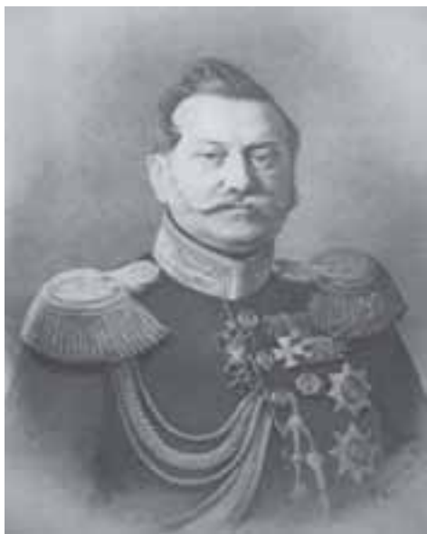
Дмитрий Алексеевич Милютин (1816 — 1912)

Но даже в таком достаточно мягком варианте расставание с сакральными фантомами всегда очень болезненно. И то, что проходило в дальнейшем (имеется в виду формирование революционного движения), по сути дела, выражало боль расставания с многовековыми фантомами. Хотя авторы реформы рассматривали сохране-