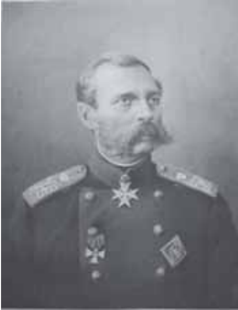
Александр II (1818–1881)

российского крепостничества — по крайней мере, с точки зрения массовой психологии такая позиция проявляет известный эвристический потенциал.