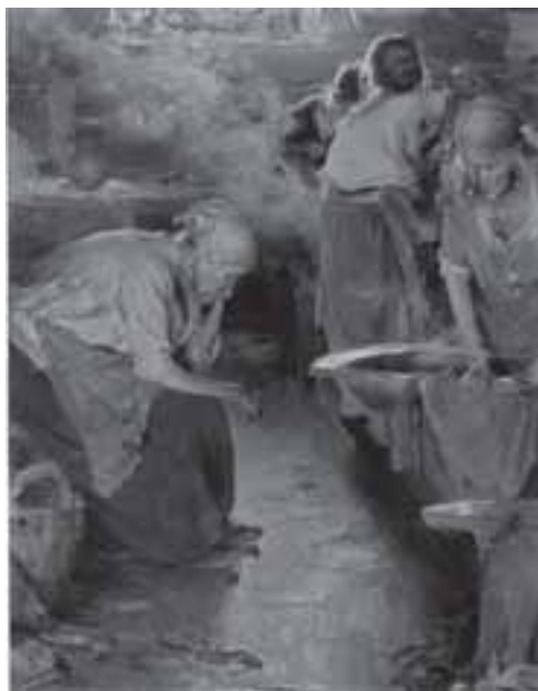
А. Архипов. Прачки. 1901

Еще одна существенная вещь. По мнению некоторых достаточно серьезных медиевистов, смутное время было, помимо всего прочего, еще и реакцией на закрепощение. Первые идеи о том, что крепостное право асоциальный и опасный институт, появились еще в XVII в. К примеру, свидетельство француза Невилля о разговоре с В. В. Голицыным (правда, полуапокрифическое), в котором В. В. Голицын излагал свою программу государственных преобразований, включавшую в том числе постепенную отмену крепостного права, а это конец XVII в. В большом конституционном проекте князя Д. В. Голицына 1730 г. изложены попытки ограничения самодержавия и мотивы