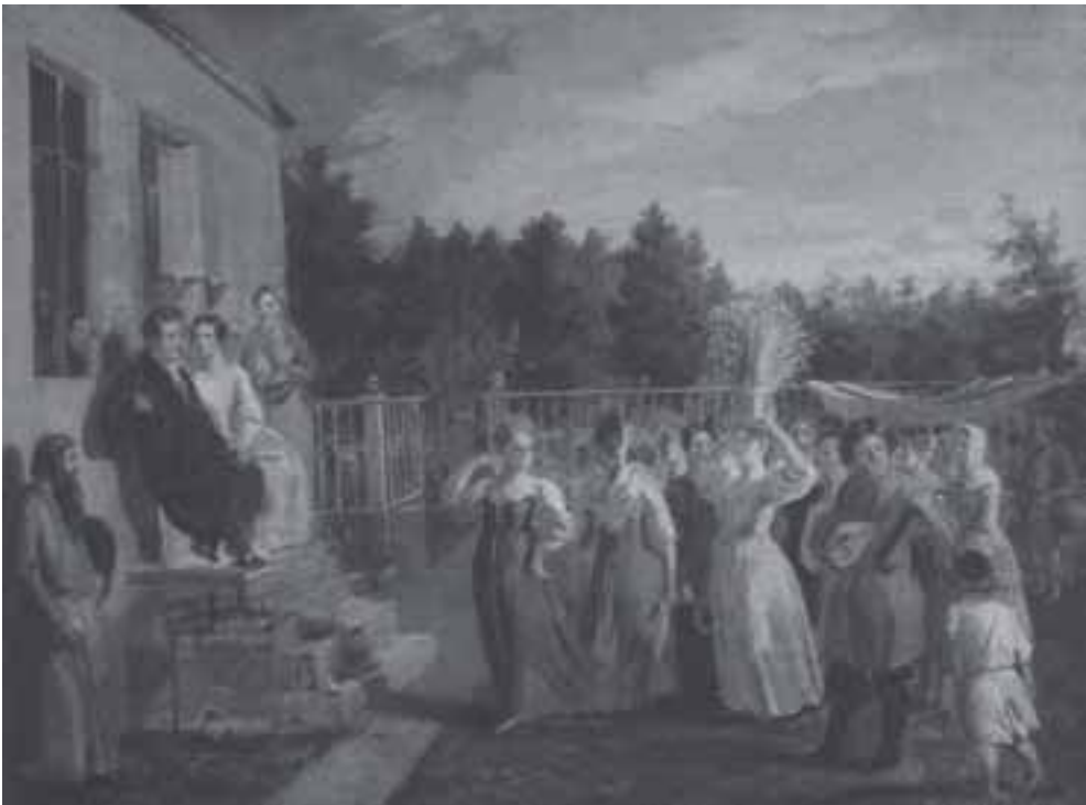
П. Заболотский. После жатвы. 1822

Эта зависимость не обязательно была зависимостью от помещика, это могла быть, как мы уже говорили, зависимость от мира, от общины, от общественного мнения