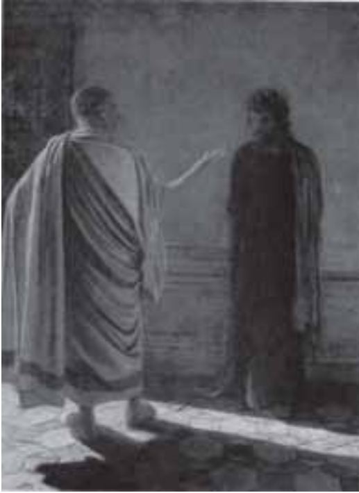
Н. Ге. «Что есть истина?» Христос и Пилат. 1890

ванном, крестьянство выполняет роль телесной массы. Дворянство выполняет некоторую роль психического, и тем не менее эти две разъединенные позиции сходятся в сакральном единстве. Поэтому, мне кажется, очень важным учитывать эти переходы.